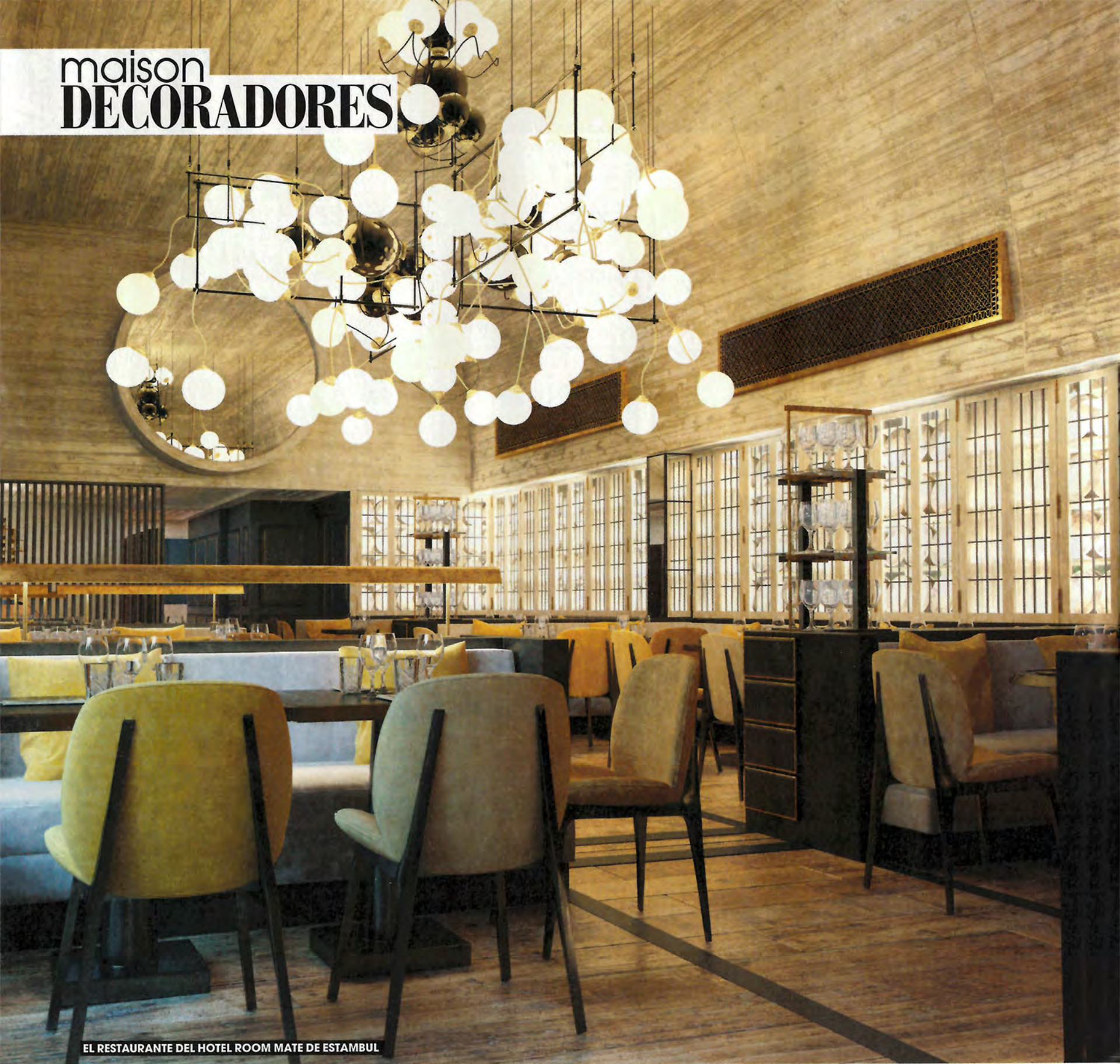
EL RESTAURANTE DEL HOTEL ROOM MATE DE ESTAMBUL