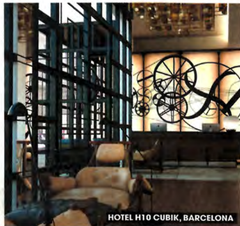
HOTEL H10 CUBIK, BARCELONA