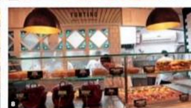
UN ESPECTACULAR ESPACIO. 1. VISTA GENERAL DE 5. LA TIENDA «GOLD GOURMET». 6. PUESTO DE «LA