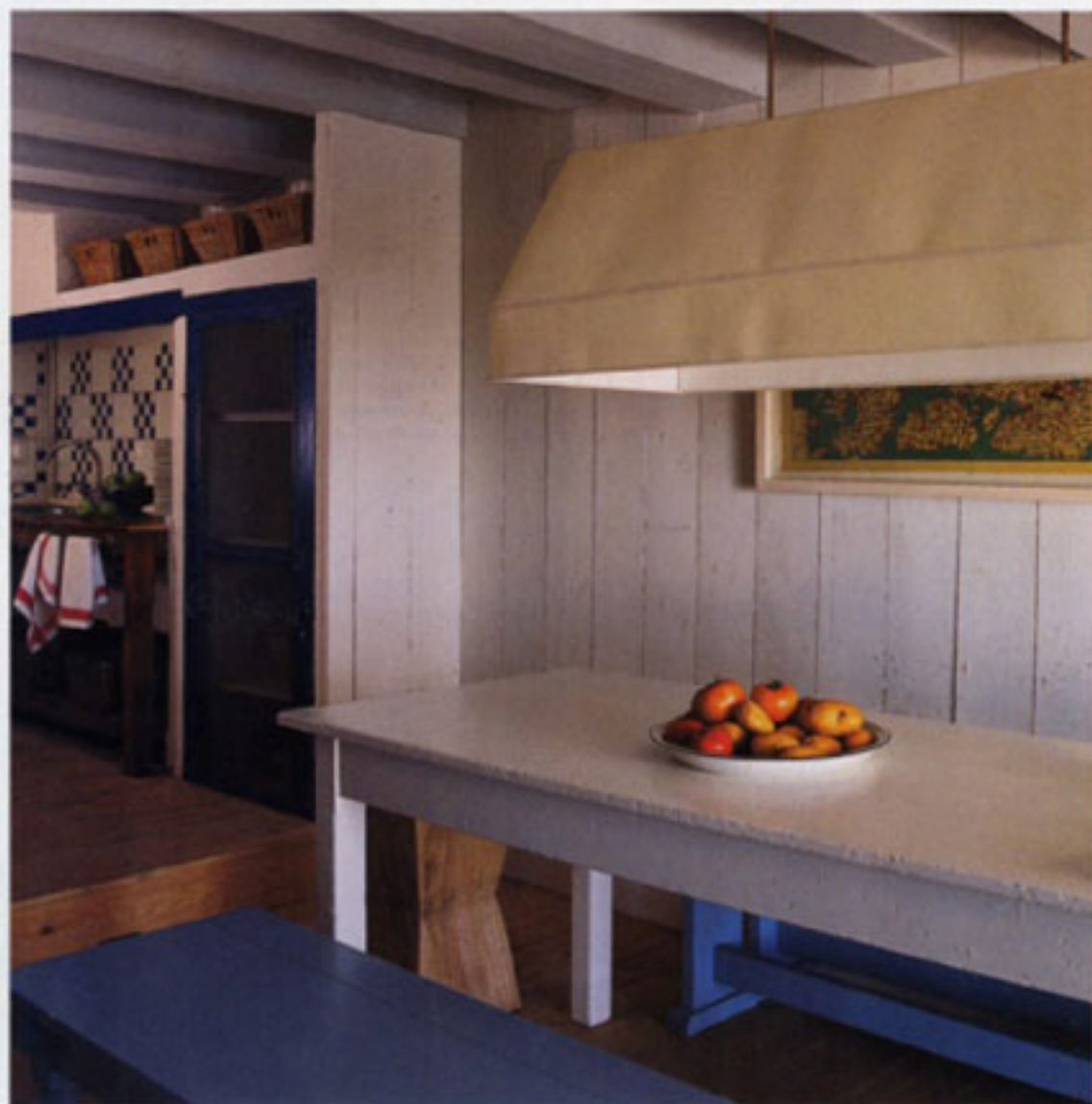
SOPRA: la stanza da pranzo, con scorcio della cucina rivestita di piastrelle bianche e blu. PAGINA SEGUENTE: un altro angolo della stanza da pranzo, che è stata arredata con mobili provenienti dal vecchio mercato del pesce. Cartina geografica giapponese del '700.

po tra questo angolo di Eden, dove ha le sue radici, e altri paradisi più lontani, come le Filippine, dove è vissuto per molti anni, il Madagascar, l'Indonesia, la Cina. A costruire questa casa è stato il trisnonno del proprietario, un uomo di mare di Palamos che aveva viaggiato in tutto il mondo e che era soprannominato "la Tigre" per la sua statura di oltre due metri. "È stata la prima casa a sorgere qui, e da allora è sempre appartenuta alla famiglia". Camos ricorda i pomeriggi estivi del-